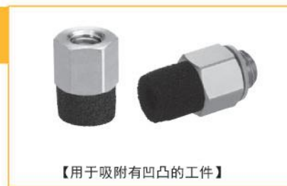
【用于吸附有凹凸的工件】